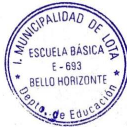
Encargada de Convivencia Escolar.