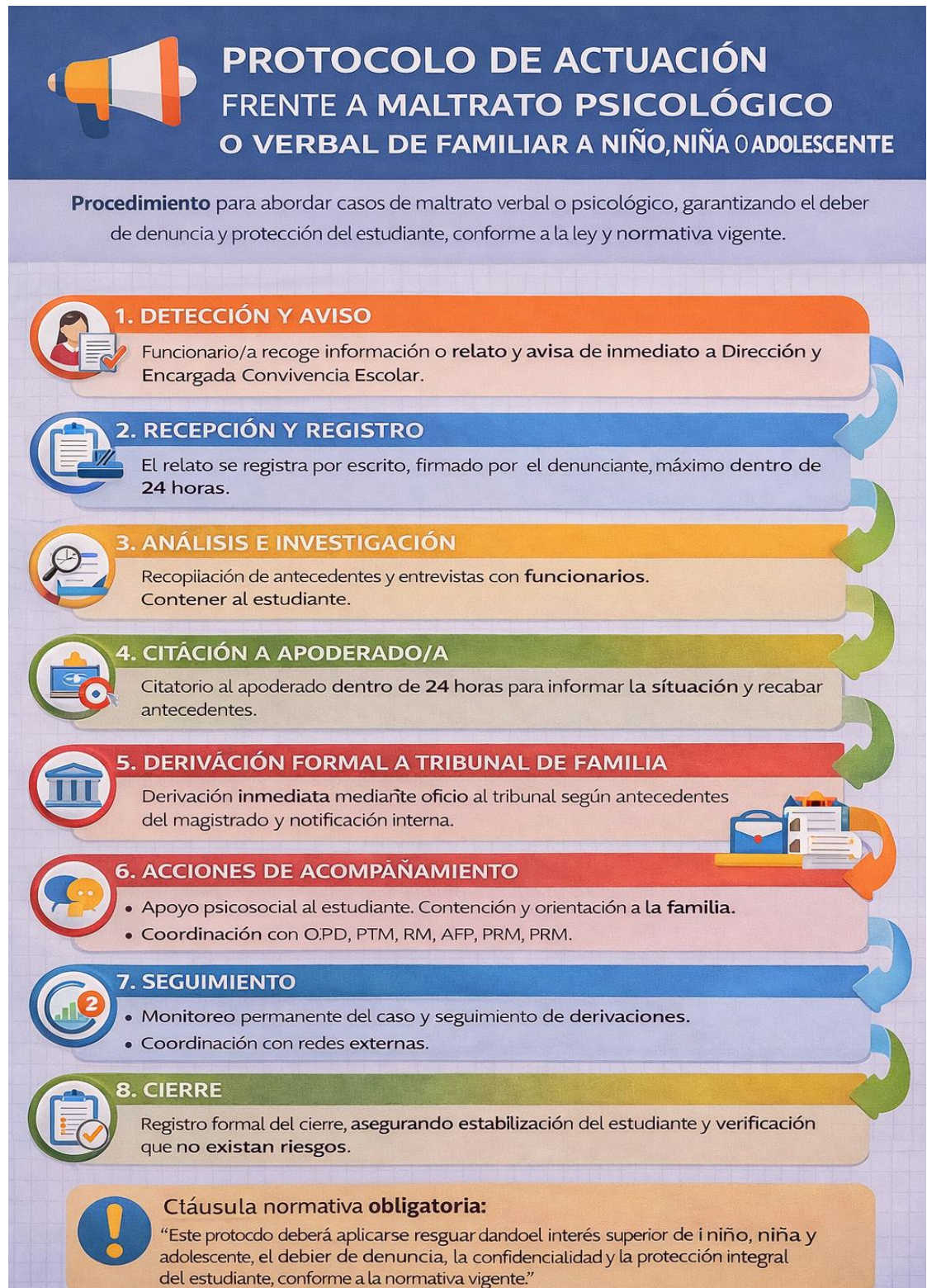
Imagen 2. Protocolo de actuación frente a maltrato psicológico o verbal de familiar a niño, niña o adolescente.

“El presente protocolo deberá aplicarse resguardando el interés superior del niño, niña y adolescente, el deber de denuncia, el debido proceso, la confidencialidad y la protección integral de los derechos del estudiante, conforme a la normativa vigente.”